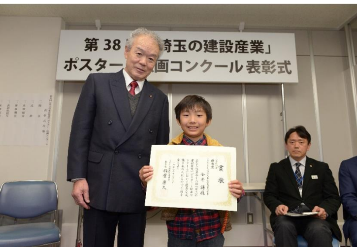
表彰状授与の風景