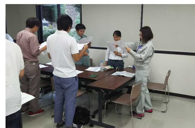
ロールプレイング