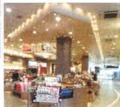
木や石を使った1階の物販ゾーン

大津市朝日が丘2-8-1 グルメ・ショッピング ☎077-510-0808 (近畿日本鉄道株式会社) インフォメーション ☎077-510-7350 レストランやフードコート、ショッピングコートは店舗によって営業時間が異なるため、以下のサイトでご確認ください。 http://www.w-holdings.co.jp/sapa/2026.html