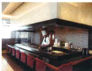
地産地消レストラン「がら川・塩味」