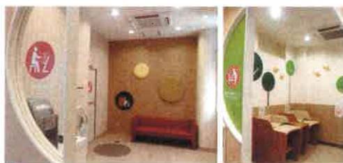
ゆったりしたベビーコーナー