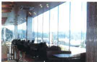
琵琶湖側に大きな窓を設けたフードコート