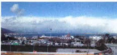
デッキからの眺望