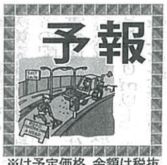
※は予定価格、金額は税抜

工業、ナカムラ工業、ナクラ設備、ハギハラ工業、原設備工業、松尾設備工業、ミヅケン、宮崎水道工業所の9社 ※106万円 最低制限 92万5千円 ▽補助配水管整備工事(左京区一乗寺向畑町) Ⅱえびす建設、辻村工業所、日本設備工業、橋本工業、伏見管工、安田管工の6社 ※453万2千円 最低制限 39.6万円