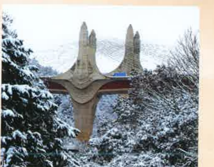
「雪のハイウェイ」 奥村 芳明 [滋賀県] <滋賀県大津市>