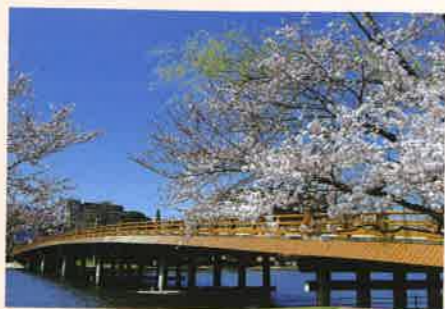
「唐橋春景」 大町 誠一 [滋賀県] <滋賀県大津市瀬田>