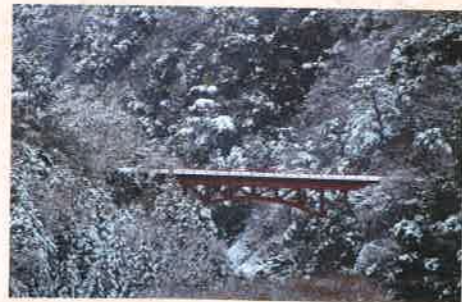
「赤い橋」 喜多 捷成 [滋賀県] <滋賀県東近江市>