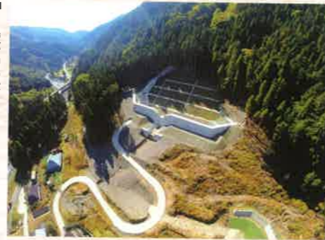
「自然の懐に抱かれて」 兼光 喜一郎 [滋賀県] <滋賀県大津市>