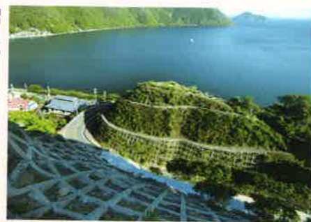
「湖北景勝」 木下 正治 [京都府] <滋賀県長浜市西浅井町菅浦>