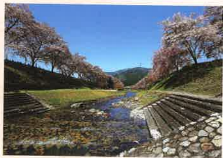
「鮎川の春」 新海 正男 [滋賀県] <滋賀県甲賀市>