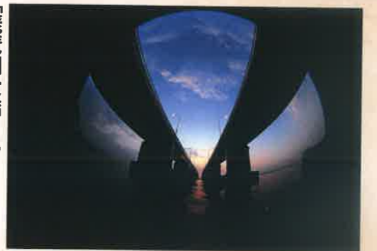
「琵琶湖大橋日の出」 瀬戸口 初男 [滋賀県] <滋賀県大津市>