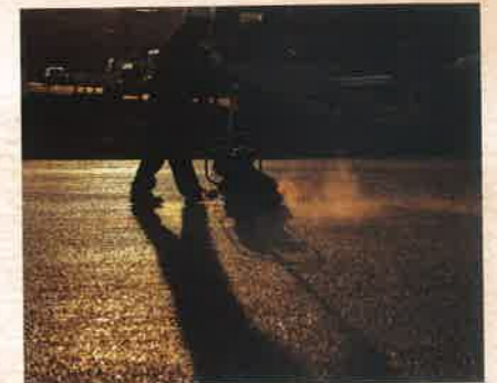
「未来に向けて」 奥村 和弘 [滋賀県]