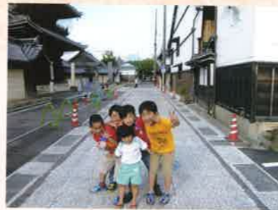
「終業後現場を通る子ども達」 北村 進次 [滋賀県] <滋賀県長浜市元浜町>