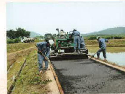
「舗装はおまかせ!!」 平谷 まなみ [滋賀県]