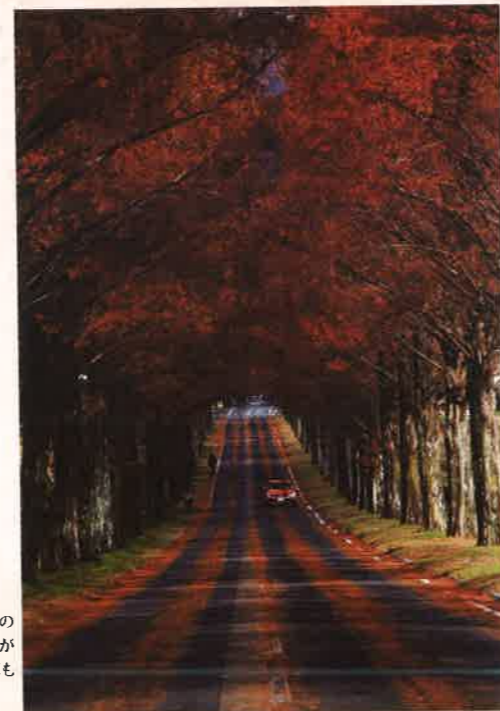
滋賀産業新聞賞 「Autumn Road (秋の道)」 前河 栄次 [滋賀県] 〈滋賀県高島市〉

黄昏時の田園の様子、豊かな水を強調し上手にまとめています。人物もよく生活感があ日常のよい光景です。