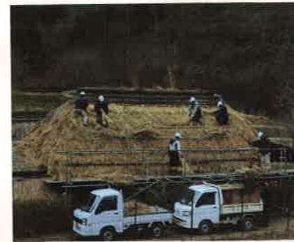
「協同作業」 杉谷 幸雄 [滋賀県]

メタセコイアの並木、撮影位置やレンズの選択がよく、秋色一色にまとめられたのが成功しています。轍のあと、一台の自動車も良いアクセントです。