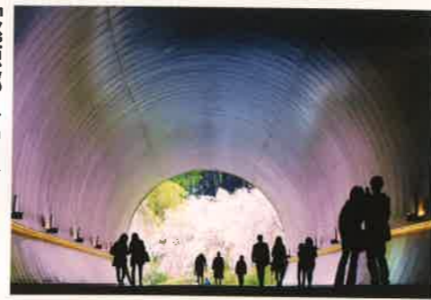
「桃源郷への入口」 矢野 暢英 [滋賀県] <滋賀県甲賀市>

評 島をイメージした橋脚、星空に浮かべてシンプルにまとめました。デジタルカメラで夜の撮影が楽になったとは言え努力が実を結びました。