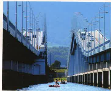
「東西を結ぶ」 塩見 芳隆 [京都府] <滋賀県大津市>