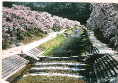
「春のうぐい川」 藤沢 迪夫 [滋賀県] <滋賀県甲賀市 鮎川>