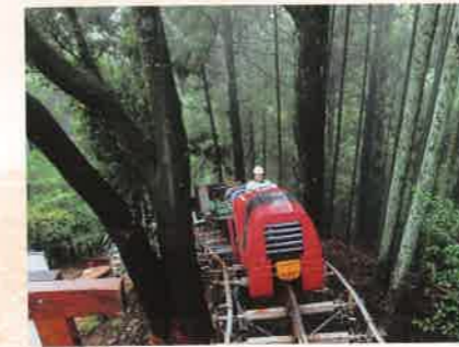
「山頂への道」 元持 伸介 [滋賀県]