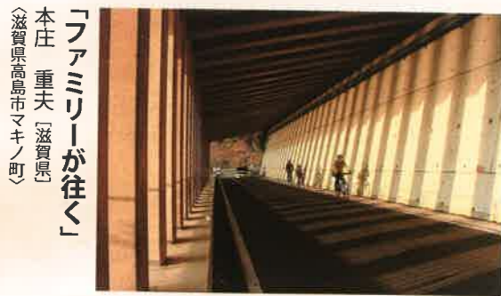
「ファミリーが往く」 本庄 重夫 [滋賀県] <滋賀県高島市マキノ町>