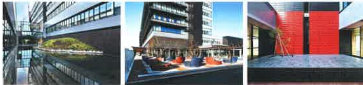
「新・長浜八景」(左から) 竹生島の景・盆梅の景・奥山の景