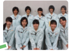
岐南工業高校建設工学科(建築類型・土木類型)2年生のみなさん

溶接など専門技術や資格が必要な仕事を見ることができました。とってまわったことかたつた。教科書を読んでいるだけでは分からないスケールの大きな現場で、迫力満点でした。杭を打つ作業はすごかった!実際に体験したことで建設業界で働く自分の姿をイメージできました