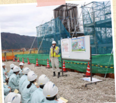
堤防護岸工事、MAGロード橋脚工事などを見学し、河川整備に対する重要性を学びました