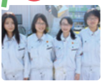
大垣工業高校建設工学科(建築類型)2年生のみなさん

見学会では普段入れない現場に入って細かい仕事を見ることができました。一つのものをつくり上げる人の技術で作られていく工程がかっこいいです。また、普段あまり見ることができない高所作業車や、本物の建築資材を見ることができて良かったです