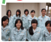
岐南工業高校1年生のみなさん

2年生になると土木/建築のどちらかを専攻するので、今日の現場見学会は大変参考になりました。形に残る、地図に載る建設業の仕事はステキです。また建設業は地域の人々の暮らしに大きく影響する大切な仕事なんだと、改めて感じました