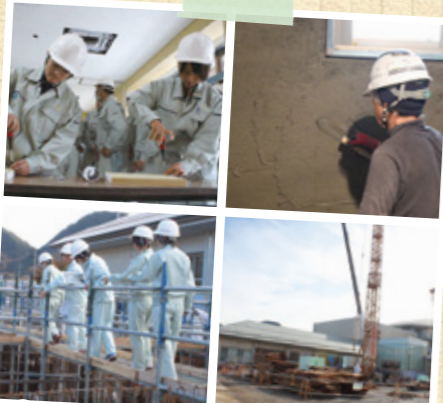
老人福祉施設および病院外来棟等の増築工事を見学し、ボードにネジを差し込む体験をしました