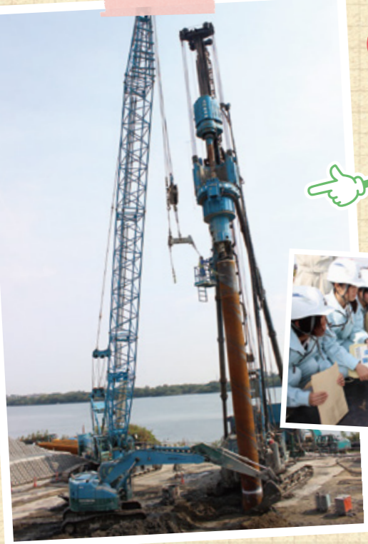
木曽川新瀬尾大橋右岸下部工事(羽島市)橋台基礎工、鋼管くい打ちの現場を見学。堤防護岸工事の説明を聞き、測量体験などをしました