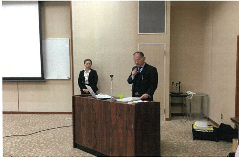
未来の京都を創る建設人になって欲しいと語った中川委員長