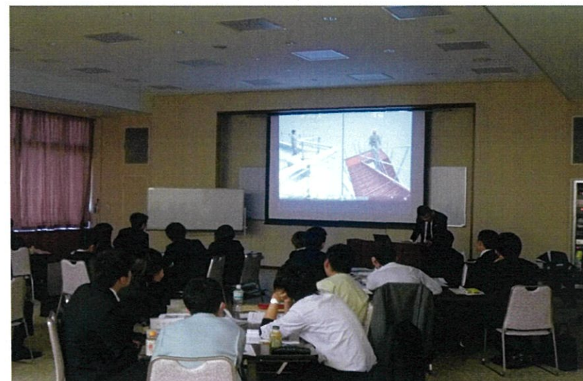
建設現場は「キケン」がたくさん。事故の実例をDVD映像で学習する。