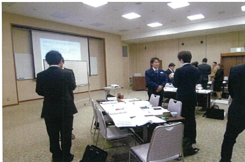
名刺交換の練習。目配り、表情、言葉遣いに気を付けて。