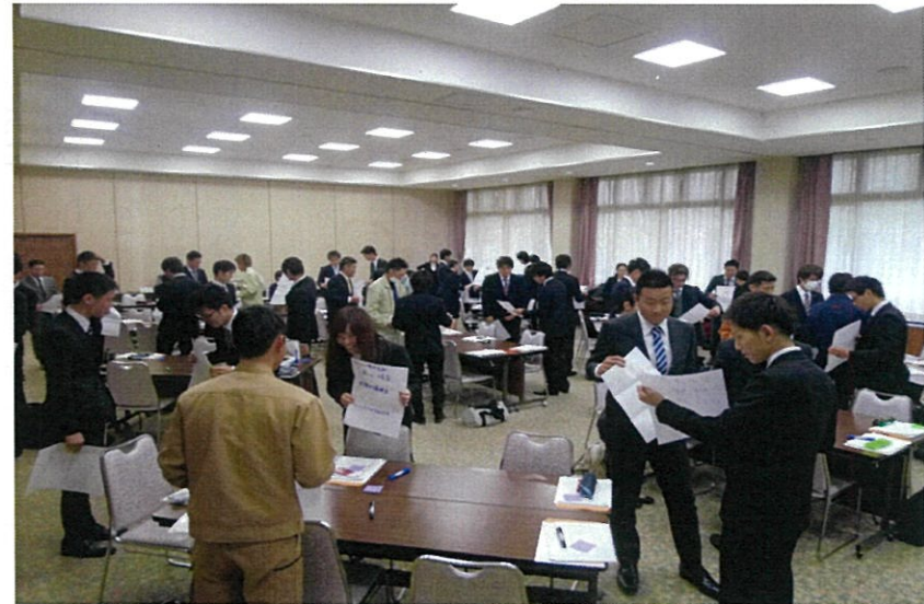
まずは自己紹介。自分の名前や趣味を模造紙に書き、レッツアピール!