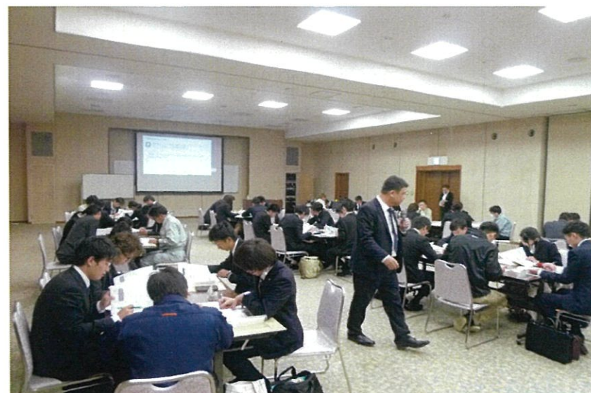
建設業法を〇×クイズ形式で学ぶ。班で積極的に討論し、答えを導き出す。