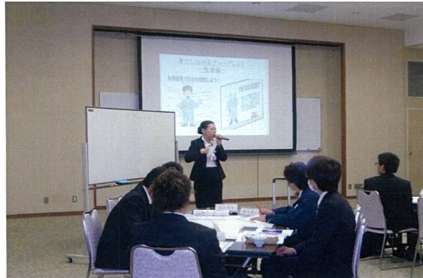
「マナーは相手への思いやり」。田辺講師は身だしなみの重要性を説く。