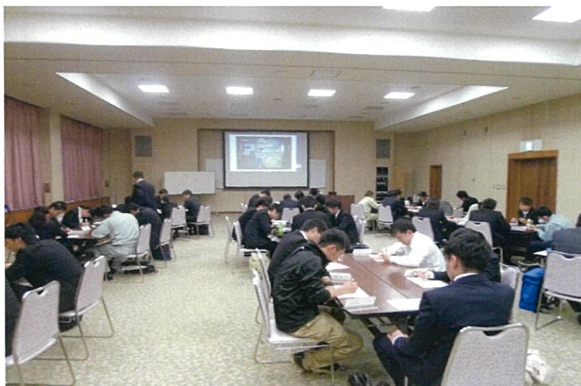
「整頓術」を学ぶ。小さい事だが、整頓が出来れば仕事の能率UPに繋がる。