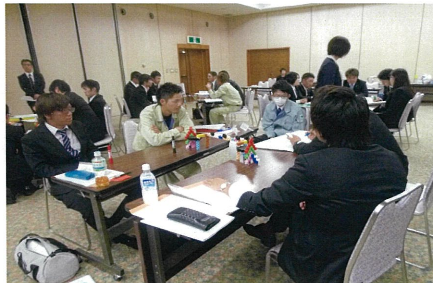
「限られたブロックで橋を造る」課題。個数や強度といった壁が立ちはだかる。