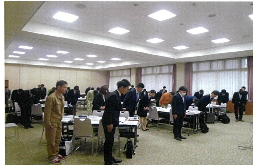
正しい挨拶は、信頼される社会人への第一歩。みんなで練習を繰り返す。