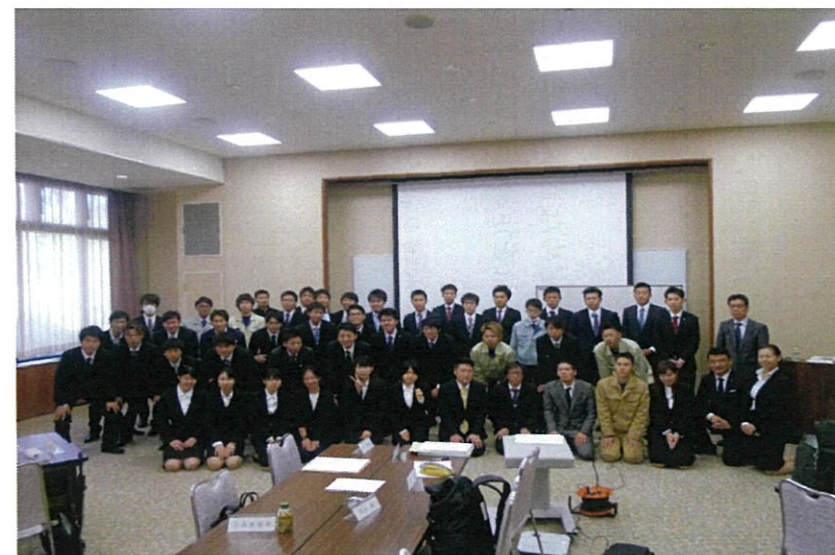
2日間の研修、楽しみながら学んでくれた46名の受講生たち。