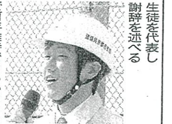
生徒を代表し謝辞を述べる

で何年維持できるかという質問について「橋梁本体は100年を目指している。阪神淡路大震災規模の地震が起きても落ちない設計になっている」、橋のコンクリートの強度について「30ニュートン」などと答えた。現場見学の後、記念撮影を行った。最後に生徒代表が「貴重な経験をさせていただいた。今日は本当にありがとうございました」と謝辞を述べ、現場見学会を終了した。