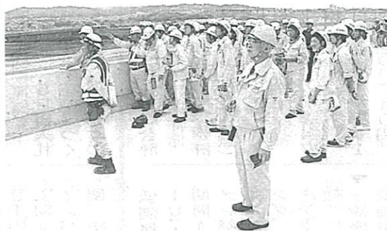
現場見学会の様子