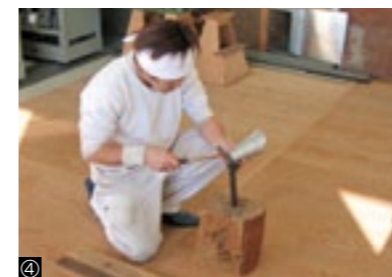
①建築科/②造園科/③配管科/④板金科