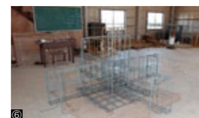
①総合座学風景／②左官・タイル施工科授業風景／③木造建築科教室／④建築板金科教室／⑤とび科教室／⑥鉄筋コンクリート施工科教室