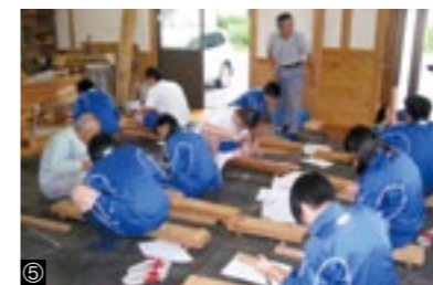
①座学教室／②実習室／③校舎天井／ ④・⑤社会人講師授業