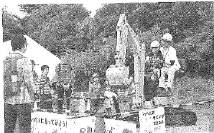
子どもたちの人気を集めた建設機械の試乗体験―榎原公苑特設会場で

建設業における若年技術者の確保・育成を目的とした「ワクワクけんせつ体験」が10月29日、30日の両日、榎原公苑(榎原市政傍町)特設会場で行われ、建設業界や重機に興味を持つ子どもたちでにぎわった。県が主催、