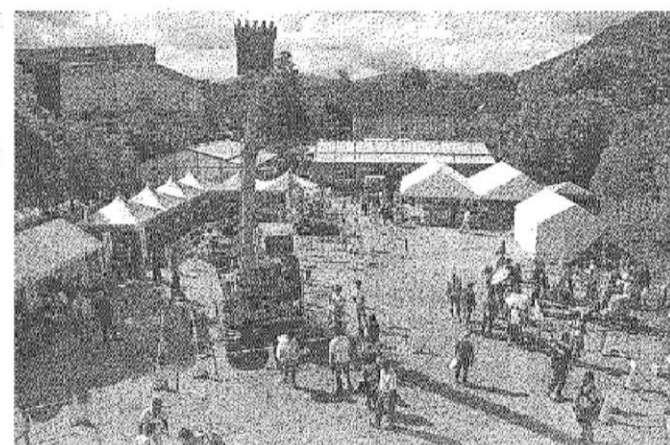
▲けんせつワクワク体験が行われた特設会場 大好評だった高所作業車の試乗体験コーナー▼

当日は、「奈良まほろば市」も同時開催されており、県立第1体育館及び西側広場では、技能に関する展示・実演・即売・ものづくり教室や技を見る特設ステージも設置されるなど、2日間の様々な企画やイベントが盛りだくさんに行われた。