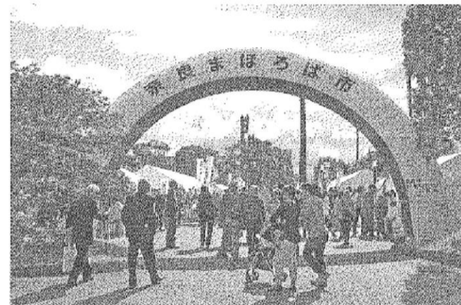
物産と食・技が大集合した奈良まほろば市