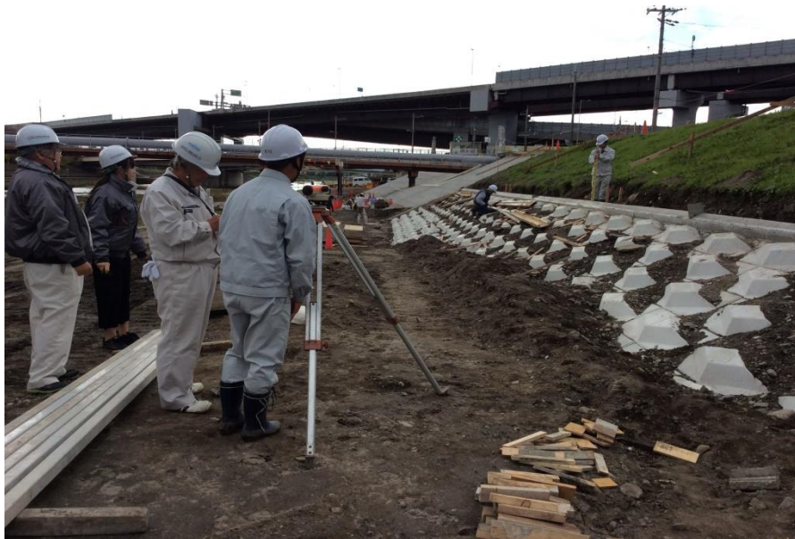
大規模な鴨川護岸改修現場で測量中の1枚。先輩方から熱い視線が注がれる。