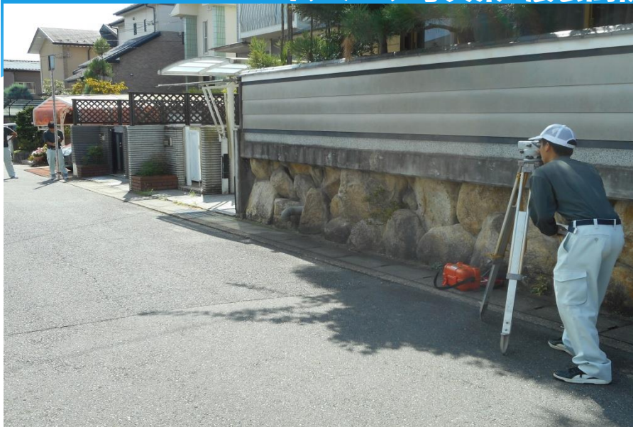
アスファルトからの照り返しで暑さが厳しい中、住宅地で測量実習中の生徒。