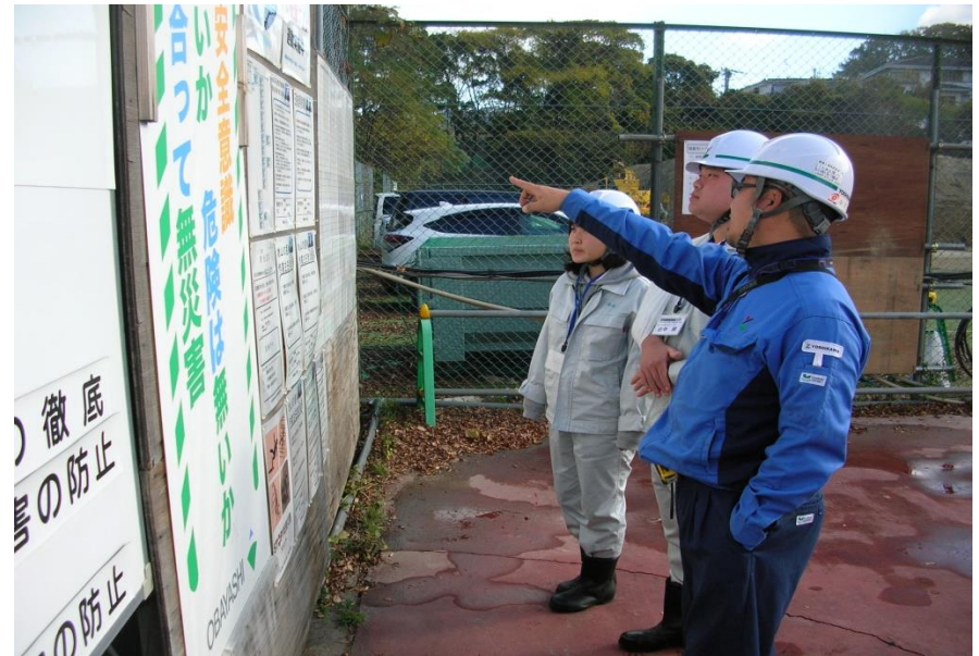
工程管理や施工に不可欠な情報が集る安全掲示板は、毎朝要チェックだ。