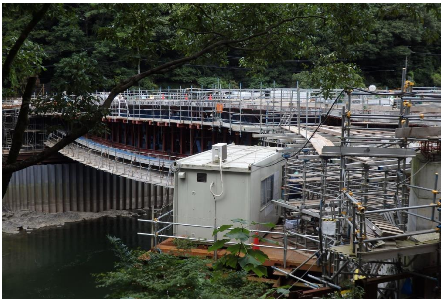
自身の実習先を映した1枚。天ヶ瀬の峡谷に架かるこの橋も、完成間近。