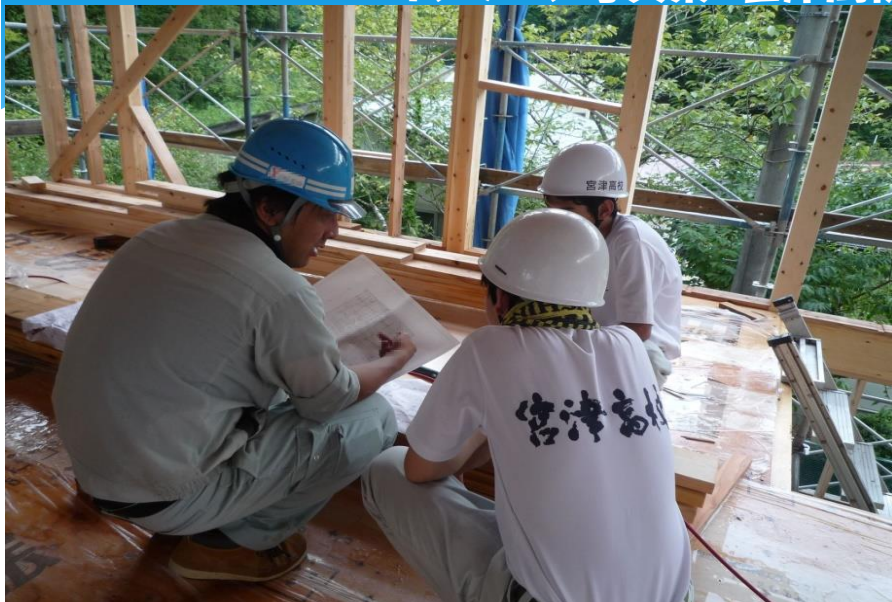
ある住宅の建築現場での風景。汗だくになりながら、図面の説明に耳を傾ける。