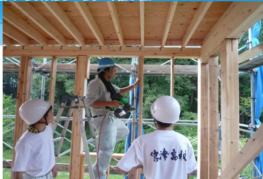
工具を片手に先輩がデモンストレーション。生徒も固唾を飲んで見守る。