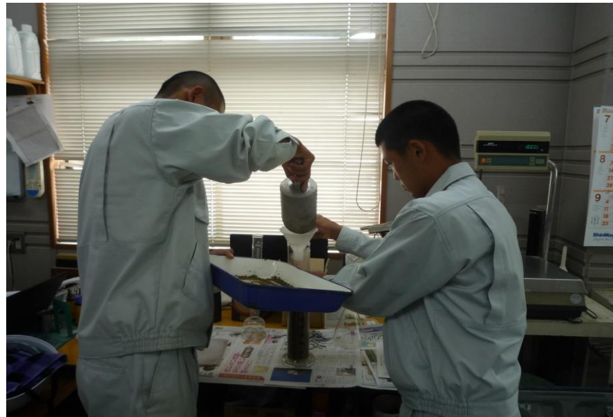
説明を受けたら実験開始！重い資材の投入を2人掛かりで支える。