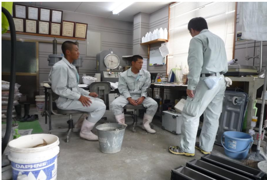
あるセメント工場内の実験室。実験の概要や机上にある器具の説明を受ける。