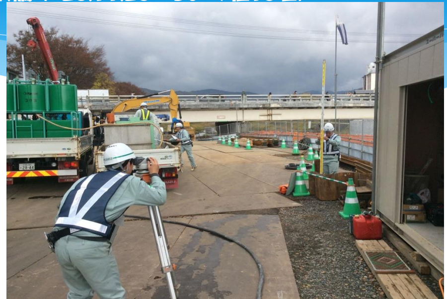
御菌橋は葵祭巡行の最後を飾る橋。多くの住民・観光客が行き交う大切な橋だ。