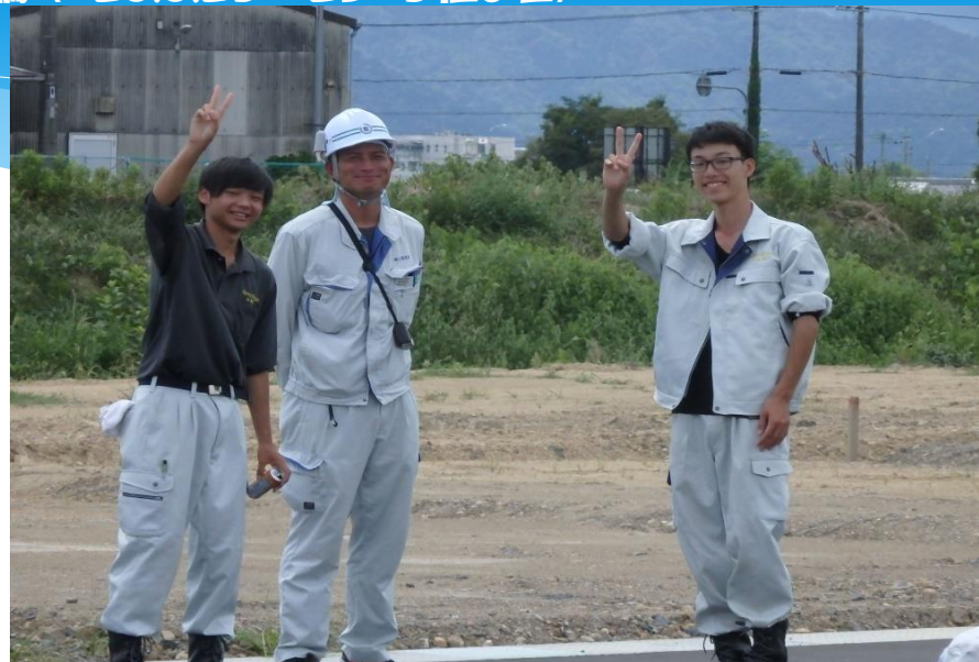
撮影者に笑顔で応える生徒たち。「仕事」を学ぶ貴重な時間を楽しんでいる様子が伺える。