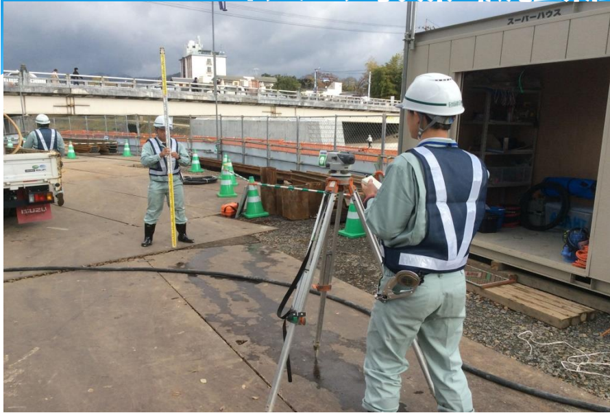
災害時の緊急輸送路にも指定された御菌橋の架替え現場で測量実習する生徒