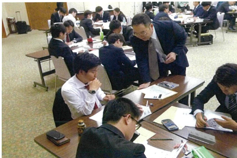
安全管理のグループ演習。班内で討議して工程表を実際に作ってみよう。