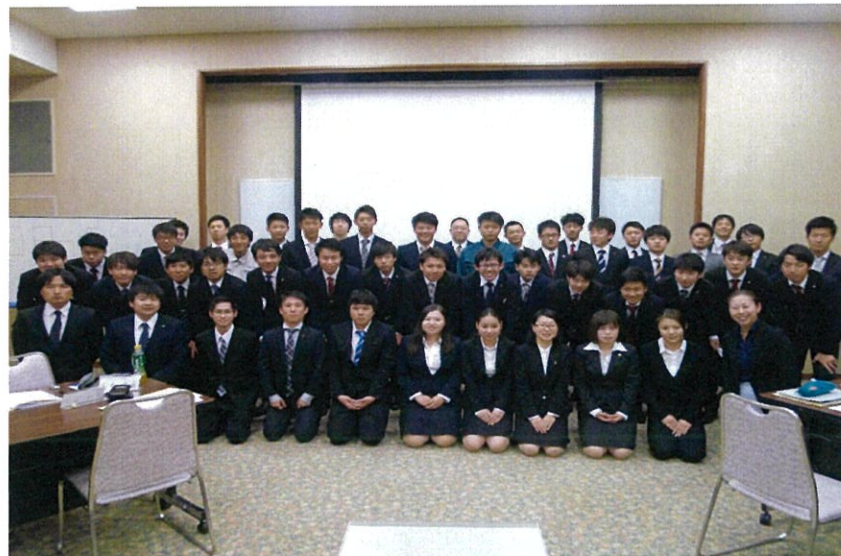
会社と京都の明日を創る45名の若き担い手たち。今後の活躍に期待。