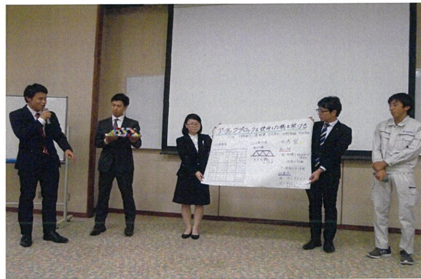
自分達の作品をプレゼン。計画・制作・発表と班内で役割分担出来たかがカギとなった。