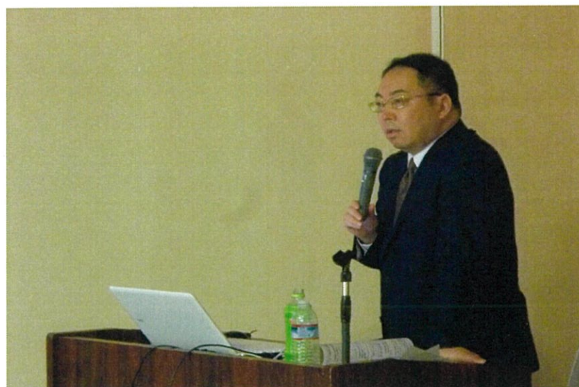
2日目の東講師は、仕事の流れをはじめ、業界の基礎知識を一から解説。