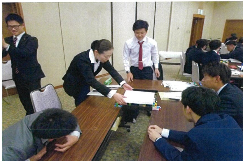
完成した橋の上にテキストを置いて強度を測る。半端な橋は、即崩落。