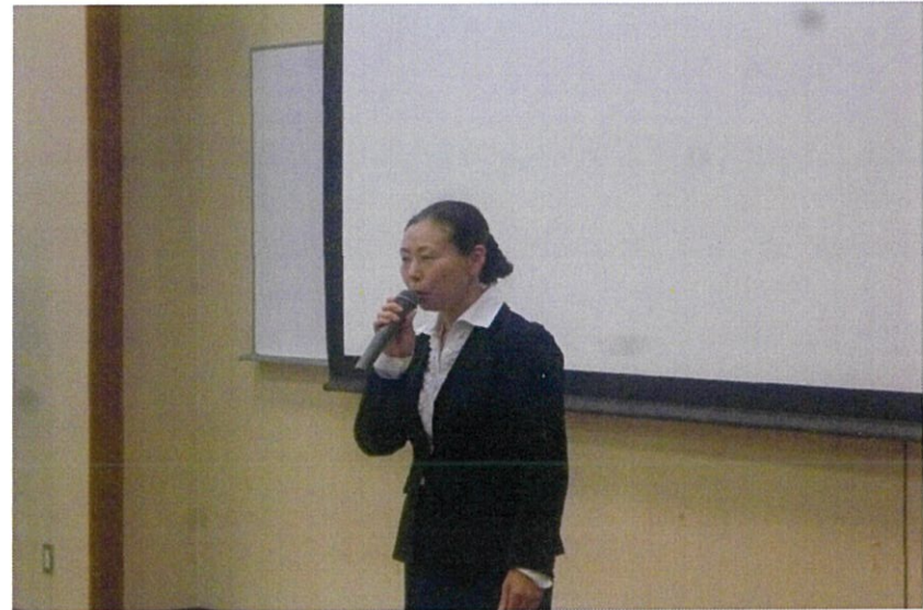
1日目の田辺講師はまず、仕事をする上で守るべき7つの心構えを説いた。