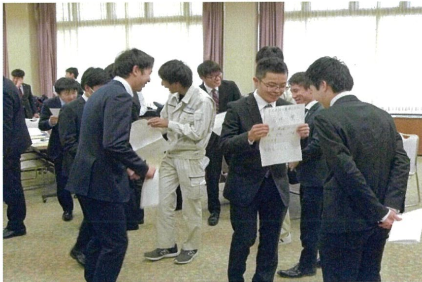
自己紹介。名前、趣味、仕事への意気込みや叶えたい夢を書いてレッツアピール!