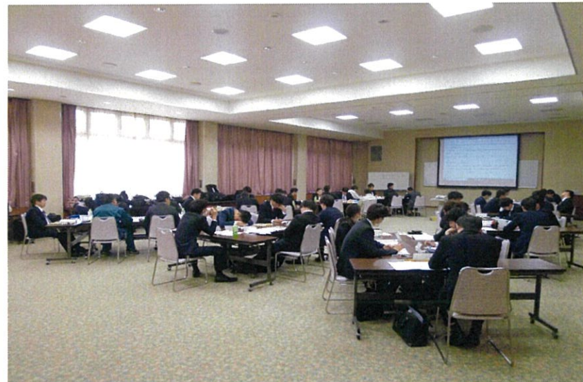
講義の範囲は業界の役割や仕事の流れ、安全管理、5Sなど多岐に渡る。