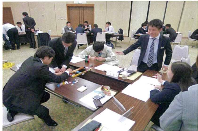
限られた時間と予算(=ブロック)で頑丈な橋を作れ!各班対抗の戦いが始まった!