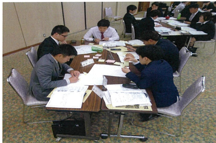
なぜ5Sが必要なのか。付せんを使って、たくさん意見を出し合おう。