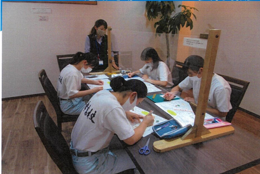
現場に入る前に、間取りをテーマにした個人ワークを行い、理解を深める。