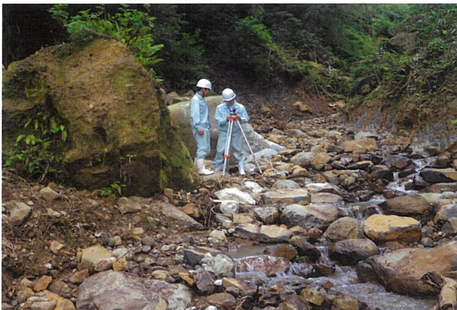
人里離れた溪谷の災害復旧現場でレベル測量中。不安定な足場に悪戦苦闘。