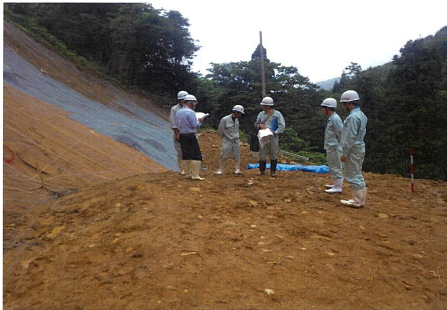
現場打ち合わせ。学生ながら、地元の災害復旧という重要なミッションに立ち会う。