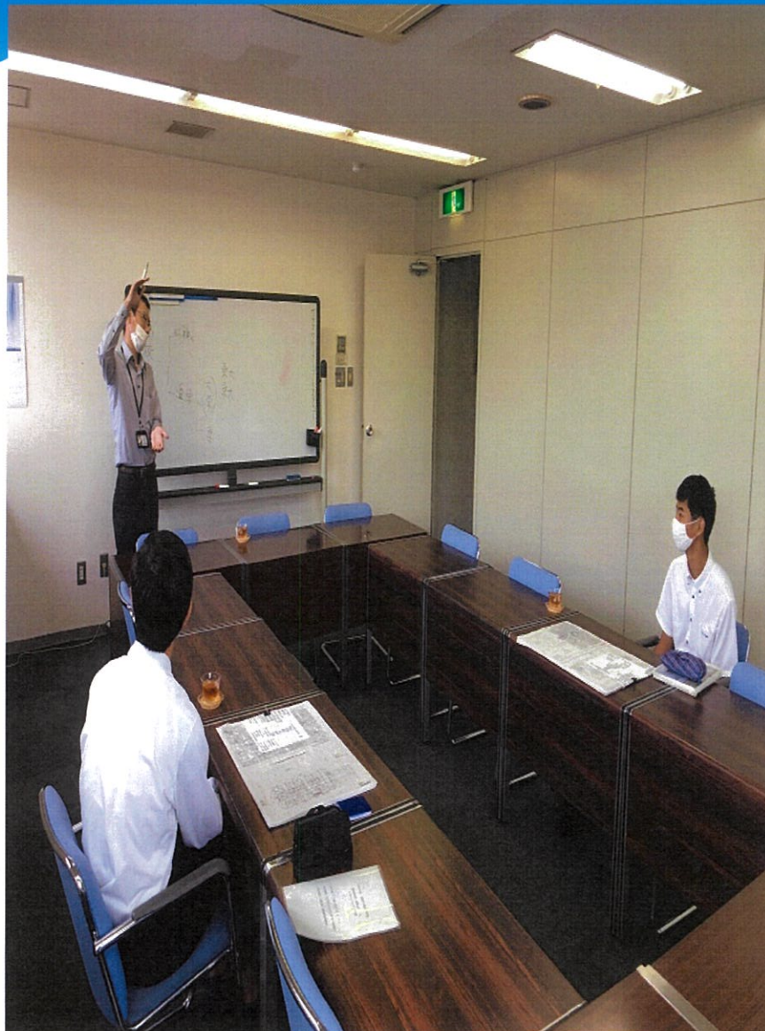
工事説明の前に、今後どう働いていくか、キャリアプランを考える機会が訪れた。