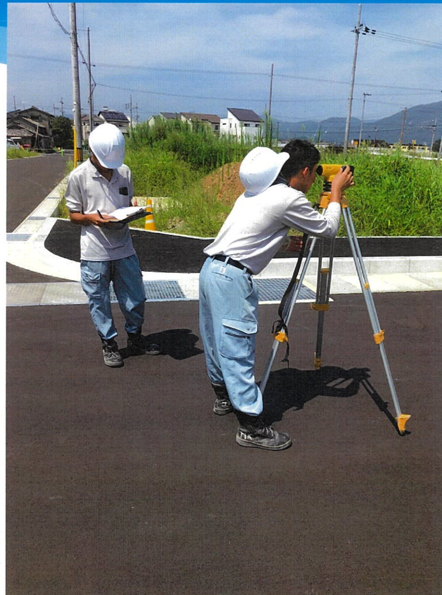
1人が測量し、もう1人がデータを記録。互いの連携プレーは欠かせない。